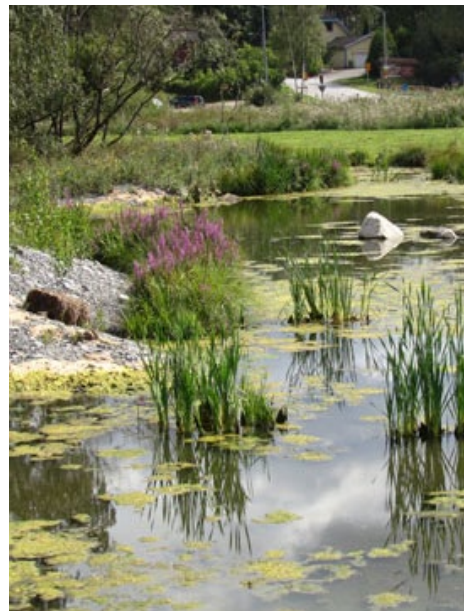
Dagvattendamm, ref Ekologigruppen

Igelbodaskolan och Fisksätraskolan och Akademiska skolan samt förskolor kan idag ta sig utan trafik Korsningar till dalen. Den har potential att bli en park där barn kan leka och lära om natur och odling i en vacker och skyddad miljö.