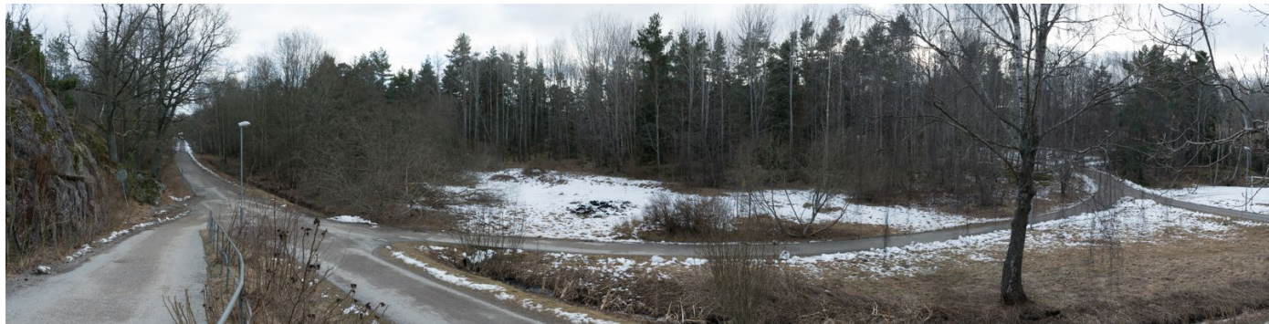
Gröna dalen idag

Det vore att bygga vidare på de bägge stadsdelarnas allra viktigaste kvalité idag: Närheten till naturen.