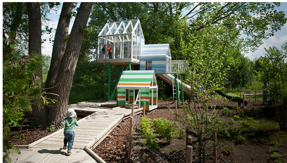
Temalekplats Gyllins trädgårdar i Malmö av Tyrens