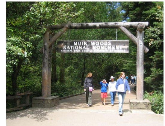
Betongbron idag och portikinspiration från USAs nationalparker.