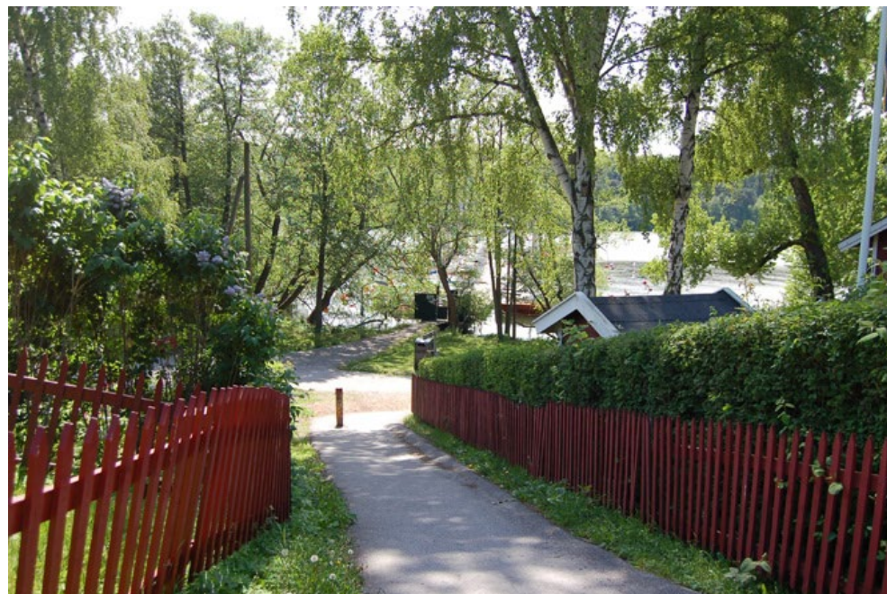
Tanto koloniområde med röda staket

Precis som i Blecktornsparken på Södermalm så finns möjlighet att ha vissa djur i anslutning till lekplatsen. I Blecktornsparken finns getter, grisar och kaniner.