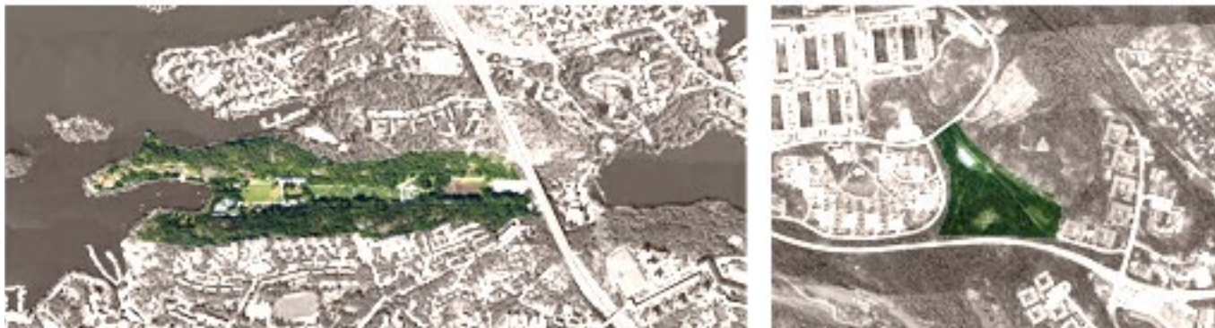
Kartjämförelse i samma skala: Vintervikens dalgång (tv) och Gröna dalen (th)