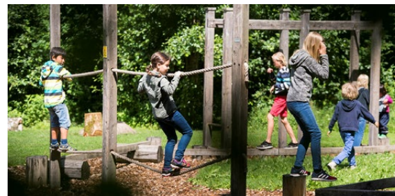
Hinderbana i skogsbrynet som utegym