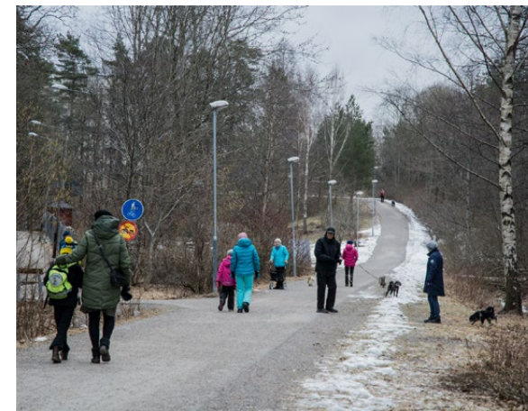
Full fart en måndagmorgon i mars