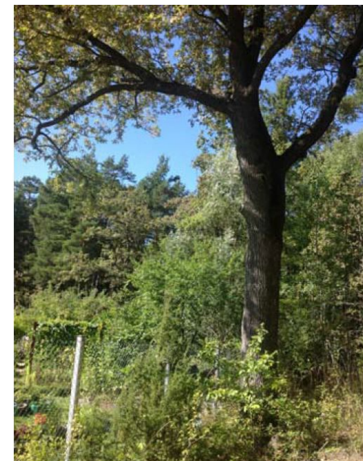
Ur Ekologigruppens kartläggning av Gröna dalen