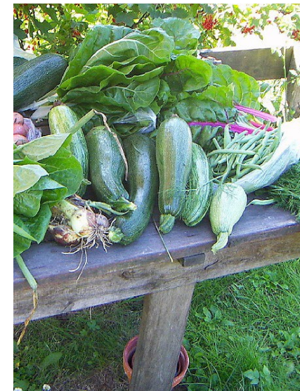
Foton från Gröna dalen kolonisterna