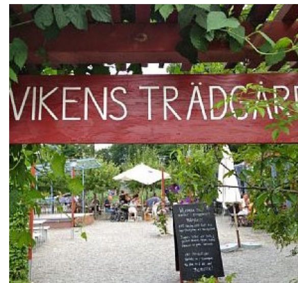
Plantskola och trädgårdskafé