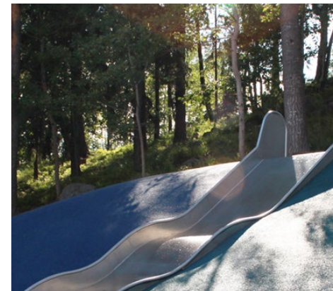
Braxenparken i Fisksätra av Topia Landskap