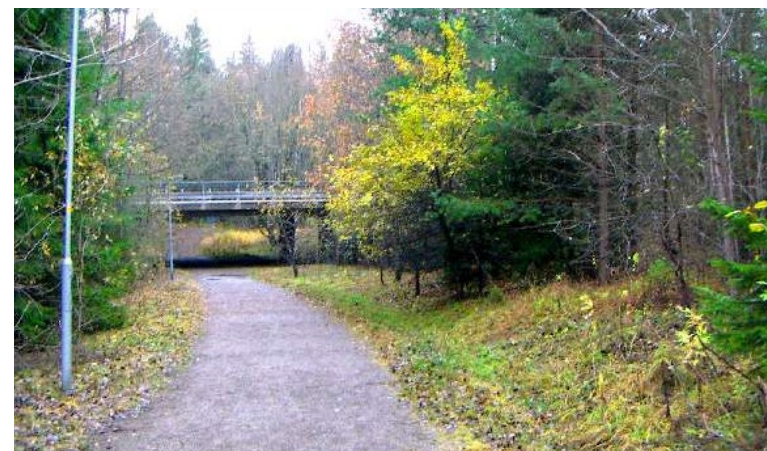
Här kan cykelvägen på Saltsjöbadsleden och Gröna dalens stigar kopplas samman om viadukten görs om till en port mot Erstavik.