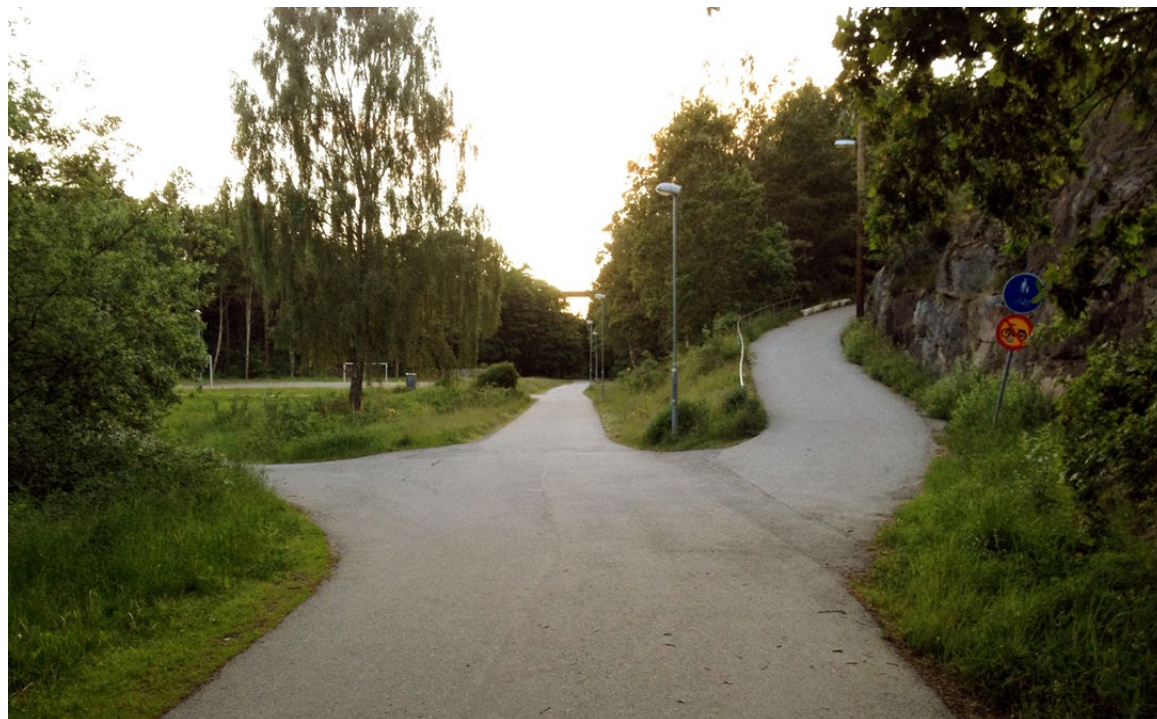
Korsning i det gröna: Fågelhöjdstigen, Svartkärrestigen och stigen till Erstavik

Ett utmärkt läge för en sammanlänkande park där två till karaktären skilda stadsdelar kan mötas i en grön miljö som tillhör till båda.